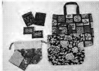
手さげ袋、定期入れ