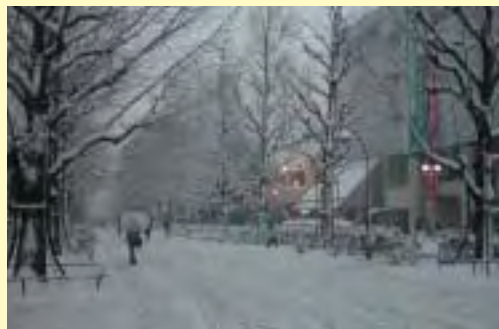
ふれあいの径冬景色