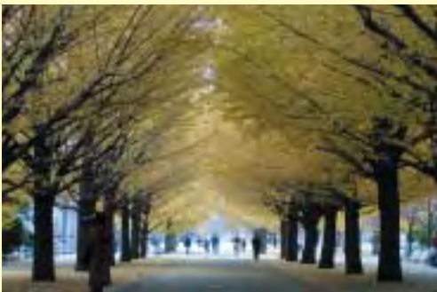
光が丘公園の銀杏並木