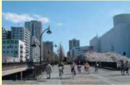
いざ、光が丘公園へ