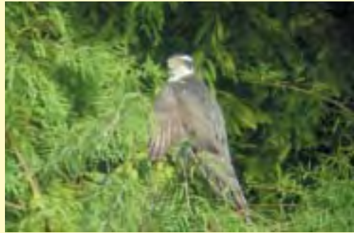
光が丘公園の大鷹