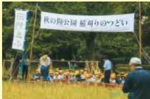
秋の陽公園での稲刈り