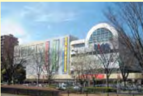
光が丘のシンボルIMA