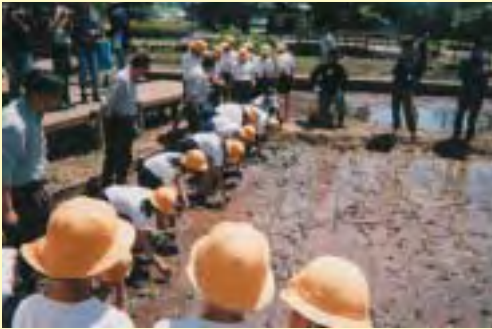
秋の陽公園での田植え